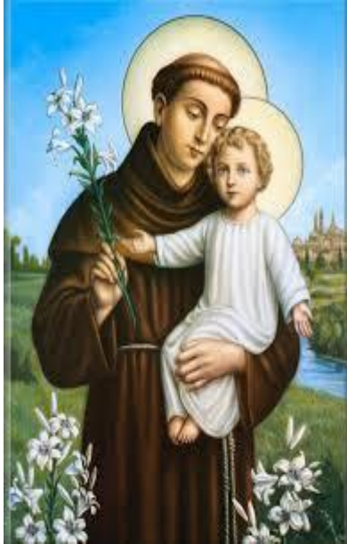
Thánh Anton Padôva